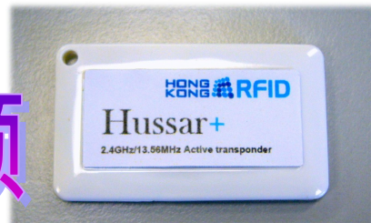
Hussar™ Slim Plus 射频识别 (RFID) 轻薄兼双频标签 (型号: HKRAT-NT02+)