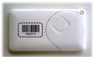
推荐标签尺寸: 15.5 毫米 x 9.6 毫米, 弧度 0.8 (背面)