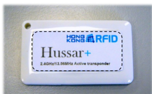
推荐标签尺寸: 40.4 毫米 x 18.4 毫米, 弧度 0.8 (正面)